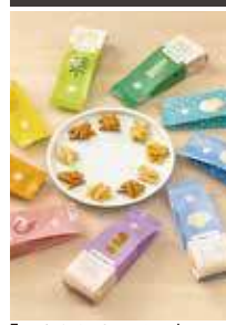
「かぎたねキッチン」