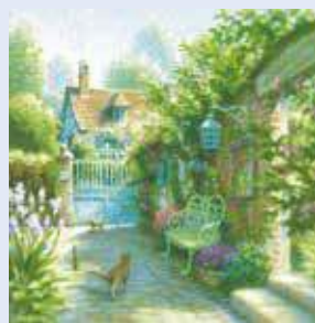
最新作「ジェルプロフ」

■あす9日(木)～14日(火) ■八丁堀本店7階催場 入場無料 (10時30分～18時30分、最終日17時閉場)