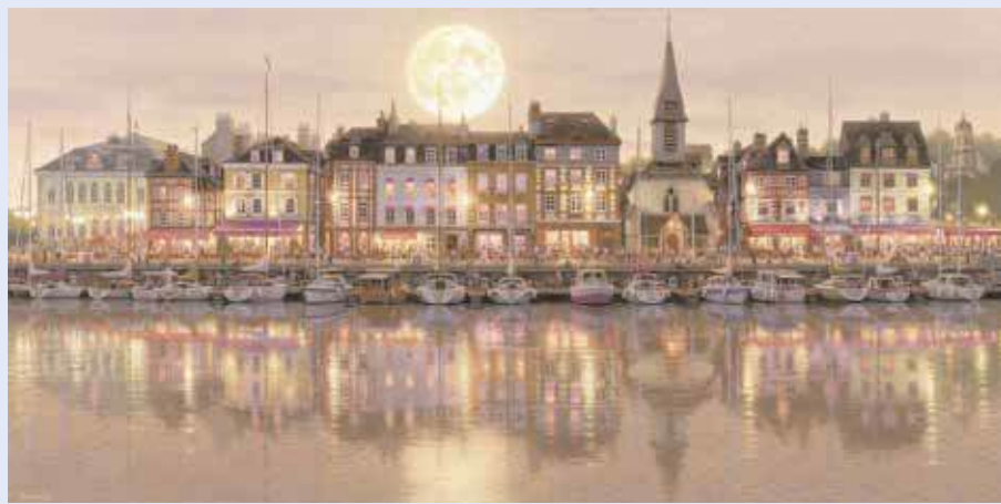
画業35周年記念作「印象・オンフルール」