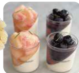
「クラークシーゲル」

◎山梨県 笛吹市産も「ふじやまの彩」のケーキ(1ホール)18,000円・(1ピース)1,500円