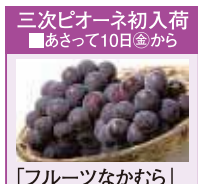
三次ビオナーネ初入荷