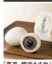
「東京・銀座たまご」

◎東京たまご こまたまご (3個入)…486円 ●レモネードたまご (4個入)…1,080円