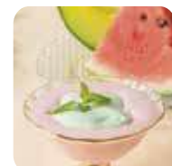
「ヨーグルト フォーシーズンズ」