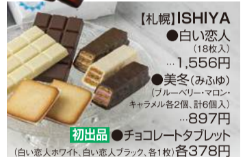
【札幌】ISHIYA ●白い恋人 (18枚入) ....1,556円 ●美冬(みふゆ) (ブルーベリー・マロン・ キャラメル各2個、計6個入) ....897円 初出品 ●チョコレートタブレット (白い恋人ホワイト、白い恋人ブラック、各1枚)各378円