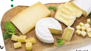
【千歳】 十勝VALLEYS ●VALLEYS 熟モツアレア (100g).....1,080円ほか