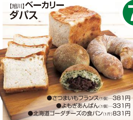
●さつまいもフランス(1個)....381円 ●よもぎあんぱん(1個)....331円 ●北海道ゴダチーズの食パン(1斤)831円