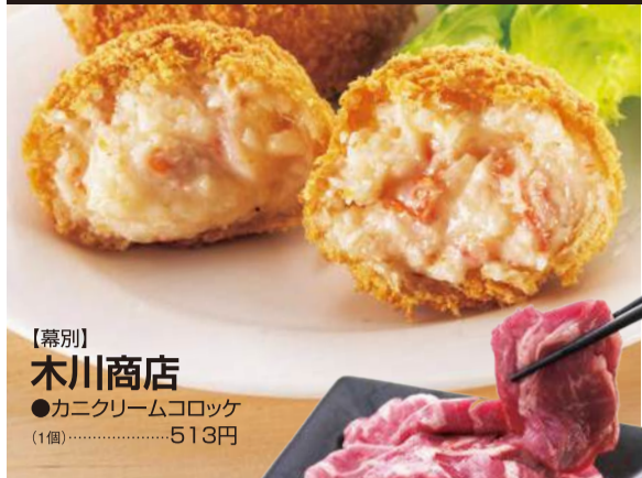
【幕別】 木川商店 ●カニクリームコロッケ (1個).....513円