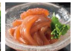
【札幌】一刀流まざり ●手切りの塩辛 (100gあたり).....1,296円