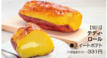
【旭川】 デディ ロール ●スイートポテト (100gあたり)....331円

●【札幌】「札幌雪だるま」北海おこわ三品詰合せ ●【札幌】「富士松製麺」生ラーメン ●【札幌】「北海道黒豆事業」幻の黒干黒食べる豆茶 ●【札幌】「さっぽろ稲穂」ジャンボいかめし ●【幕別】「十勝 大望」野菜フレック ●【旭川】「イワシタ」海藻サラダ ●【帯広】「福田農場」大納言、大正金時豆、ピュアホワイト、恵味ゴールド ●【釧路】「カナタ高橋商店」天然らうす切り出し昆布(順不同)