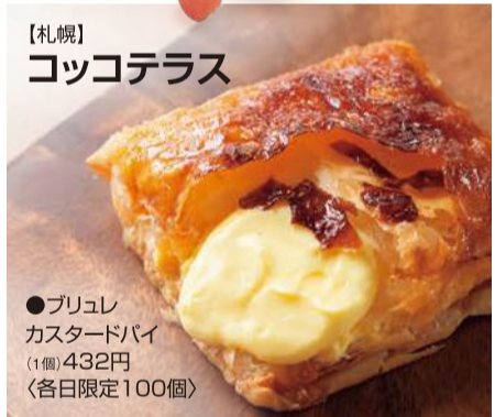
【札幌】 ココテラス ●ブリュレ カスタードパイ (1個)432円 (各日限定100個)

●「北海道ワイン」創立50周年 記念醸造ワイン ●【函館】「函館ミニョン」プレミアムミックスゼリー ●【砂川】「北菓楼」北海道開拓おかし ●【札幌】「五洋物産」じゃがぼお プレーン ●【釧路】初登場「クシロー」手焼きさきいか (順不同)