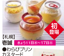
【札幌】 吉誠 きょう11日(水)~17日(火) ●わらびプリン カスタード (1個) 594円から