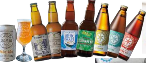
北海道クラフトビール特集 ●月と太陽BREWING Pale Ale (355ml)651円ほか