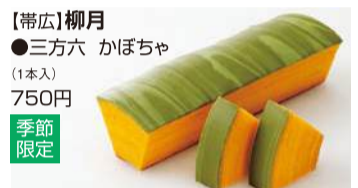
【帯広】柳月 ●三方六 かぼちゃ (1本入) 750円 季節 限定