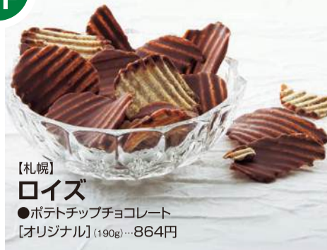
【札幌】 ロイズ ●ポテトチップチョコレート 【オリジナル】(190g)....864円