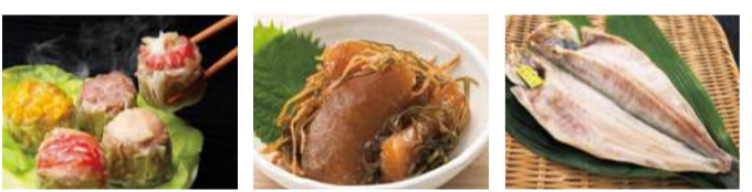
【北斗】華隆 ●しゅうまい5種盛合せ (10個入).....1,751円