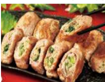
【中札内】十勝野フーズ ●十豚巻き(行者にんにく) (8個入).....1,944円