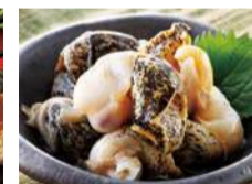
【寿都】山水産 ●灯台つづ やわらか煮 (100gあたり).....1,681円