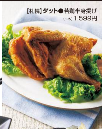
【札幌】ダット●若鶏半身揚げ (1本)1,599円