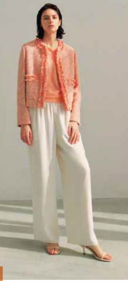
EPOCA 2025年春夏のテーマは“Whim Of Nature” 自然の美しさや力強さを表現しながら、繊細さと調和を持たせたコレクションを展開