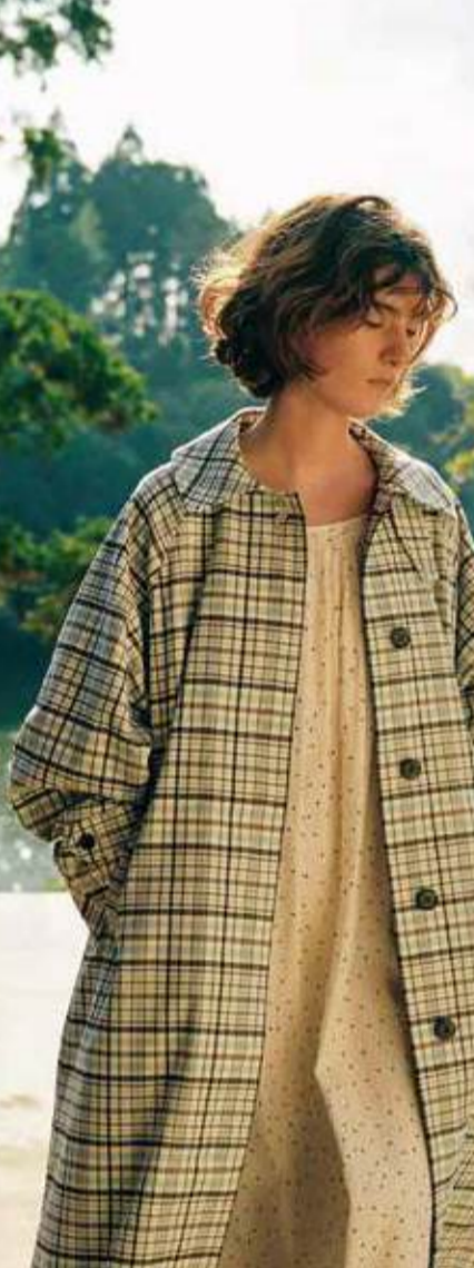
emmi [Create Your Own Life] emmi 2025年春夏の新作をお届け