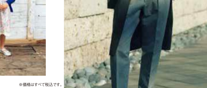
zippà di zuccà 春の出かけが楽しくなるリバーシブルワンピース